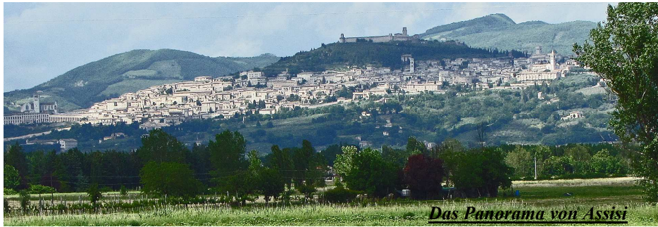
Das Panorama von Assisi

lokale Spezialitäten serviert wurden. Bei der Rückkehr am Abend wurden wir wiederum von einem 3-Gänge-Menu inclusive unbegrenztem Wein- und Wasserverzehr erwartet.