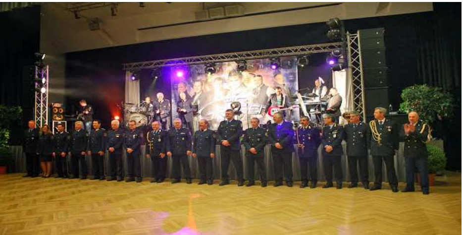
Eröffnung des 49. IPA-Balls - alles Walzer -

Um 10.00 Uhr des 01. Februar fand der Empfang bei der Bezirkshauptmannschaft Bruck/Mur-Mürzzuschlag statt, an dem eine Reihe von führenden Persönlichkeiten des öffentlichen Lebens teilnahm. Nach einer kurzen internationalen Verkehrsregelung in Kapfenberg nahmen wir über Einladung der Bürgermeister von Bruck/Mur und Kapfenberg im Gasthaus Schicker in Kapfenberg ein köstliches Mittagessen ein. Auch dabei waren zahlreiche Ehrengäste anwesend.